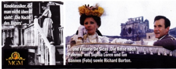
Kinoklassiker, die man nicht überall sieht: ‚Die Nacht des Jägers‘.