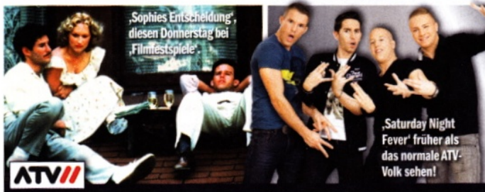
‚Sophies Entscheidung‘, diesen Donnerstag bei Filmfestspiele.