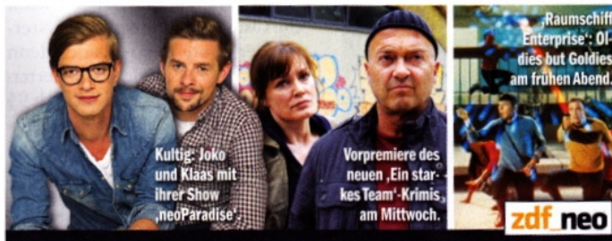
Kultig: Joko und Klaas mit ihrer Show ‚neoParadise‘.