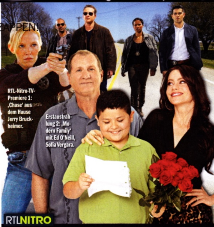
RTL-Nitro-TV-Premiere 1: „Chase“ aus dem Hause Jerry Bruckheimer.